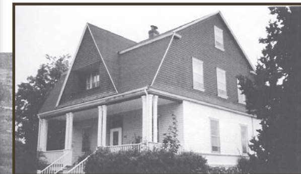
4) La maison du directeur School principal house