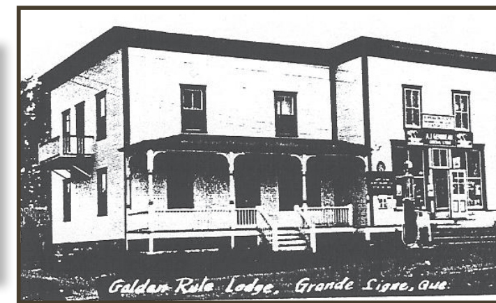
5) Le magasin général et le bureau de poste General store and Post office