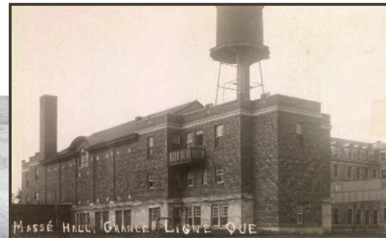
3) Le Massé Hall vu de l'arrière - Massé Hall (back view)