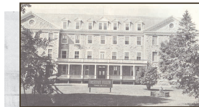
1) L'Institut Feller au 20 e siècle. Feller Institute in the 20 th century

Nous nous intéresserons à ce qui reste de ces deux pôles aujourd'hui: le Massé Hall, l'église baptiste Roussy Mémorial.