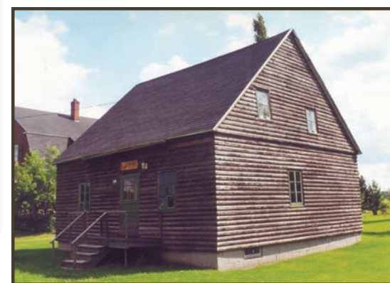
10) La maison Lévêque refaite à l'extérieur (Musée Feller) - Lévêque house (Feller Museum)