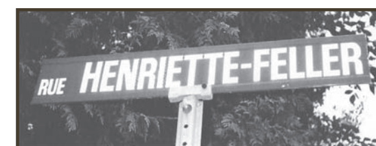
11) Rue Henriette-Feller - Henriette Feller St.